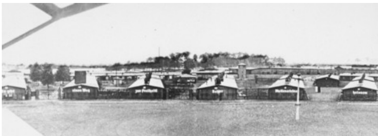
Vue générale de Saschsenhausen.

Pendant l'été 1936 on abattit des arbres et on érigea une baraque en bois au milieu de la forêt d'Oranienbourg, sur le territoire de Sachsenhausen. Le 12 juillet 1938, les 50 premiers prisonniers en provenance d' Esterwegen arrivèrent et furent immédiatement mis au travail pour la construction de ce qui allait devenir le camp de concentration de Sachsenhausen (K.Z. Sachsenhausen). Dès août et septembre 1938, 900 autres prisonniers furent transférés d'Esterwegen à Sachsenhausen pour travailler à la construction du camp. Très peu d'entre eux survécurent au rythme de travail infernal imposé par les SS. Fin septembre, les premiers prisonniers politiques arrivèrent au camp.