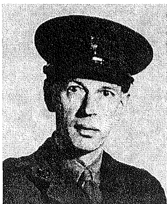
Colonel Maurice Buckmaster Chef de Section F 1941 - 1945

La Section F du SOE expédia environ 420 agents en France. Ils furent, soit parachutés, soit posés au sol par des avions Lysander ou Hudson, soit déposés sur la côte par bateau ou sous-marin.