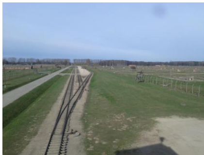
Auschwitz-Birkenau cumule les fonctions de camp de concentration et de centre d'extermination

Avant d'être assailli de chiffres, il convient de clarifier ces deux systèmes à l'aide de définitions et d'applications pour faire clairement apparaître les différences entre eux. L'intérêt de cet exercice est d'éviter un usage parfois erroné de ces termes et de ces dénominations ainsi qu'une confusion dans le vocabulaire utilisé. La mise en évidence claire de ces différences permet aux chiffres mentionnés par la suite de ne plus être seulement une donnée quantitative et quasi « inhumaine », mais fait mieux percevoir l'ampleur et la gravité du génocide – en l'occurrence du judéocide . L'article expose les deux systèmes en les mettant chaque fois en parallèle.