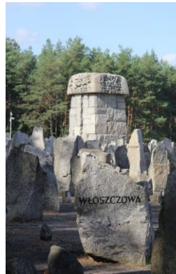
Monument de Treblinka – Centre de mise à mort

On se sent assez mal à l'aise d'un centre tout le monde, sans arrivée. Il serait sans doute mises à l'écart». Pour nombre extrêmement échapper à une mort concentration, les centres Avant même la libération avaient effacé leurs traces survivant. Des travailleurs de déportés, ont dû faire le cheveu des femmes qui des chambres à gaz, enlever jeter les cadavres dans des