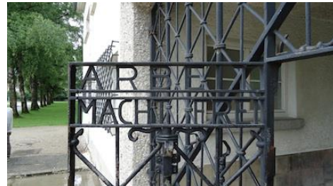
Dachau

Le premier camp de concentration dirigé par les SS, celui de Dachau, portait le slogan que l'on connaît surtout aujourd'hui pour être celui du camp d'Auschwitz : « Arbeit macht frei ». Il reflète l'idée qu'un détenu peut effectivement être libéré d'un camp de concentration. Himmler a indiqué dans plusieurs camps, dont celui de Dachau, quelle était la morale qu'un détenu devait respecter pour pouvoir retrouver la liberté 5 .