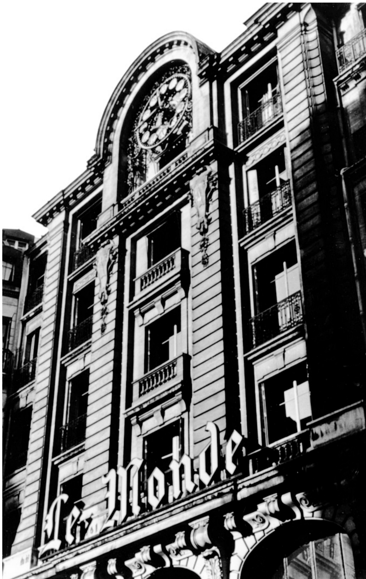
Ci-contre, l'immeuble du « Monde », rue des Italiens, dans le 9 e arrondissement de Paris.